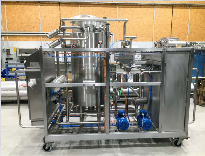
Mobile CIP-Anlage vom Typ EVOLUTUON